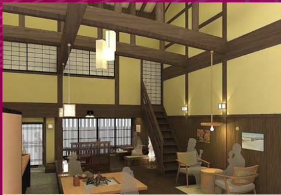
宿場町の古民家 カフェギャラリー

歴史あるこの宿場町で懐かしい風景と文化に触れてほろりと心がほぐれる空間をご提案いたします。