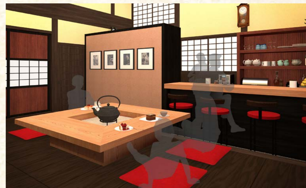
囲炉裏の間 & カウンター席

大きな吹き抜けが心地よい「囲炉裏の間」は座敷席になっており、小さいお子様 も安心して過ごせます。昔話に出てきそうな囲炉裏の席は座ってみるとどこか懐 かしくて温かく、自然と会話が弾む、癒やされる空間です。間隔が広めに取られ たカウンター席も、挽きたての珈琲の香りを楽しみながらゆっくり過ごせます。